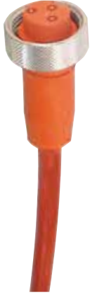
JUEGO DE CABLE HEMBRA